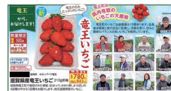
3月2回コープしがマルシェで企画された竜王町いちご

市町との包括連携協定の締結は竜王町が初めてです。くらしは見守り・災害時の協力と限定されるものではなく、食や健康など多岐にわたるため、コープしがでは、お役立ちの可能性を広げるためにも包括連携協定をすすめていきたいと考えています。