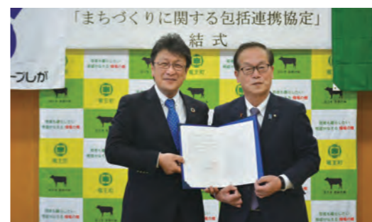
竜王町との協定締結式の様子 (2022/3/24)