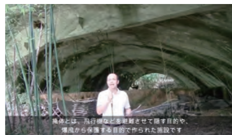
八日市掩体壕の紹介動画

コープしがでは毎年バスで県内戦争遺跡巡りを実施していましたが、今年はオンライン企画として開催しました。滋賀県内の戦争遺跡や戦争体験について、動画や写真を見ながらお聴きし、平和について考える機会となりました。