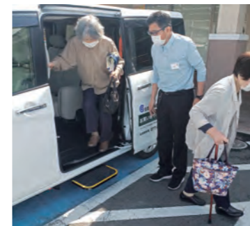
お買い物サポートカー

お店でのお買い物をサポートする仕組みの1つである「お買い物サポートカー」は、食料品などのお買い物が不便な方を対象に、ご自宅からお店まで無料で送迎するサービスです。2021年からは、コープもりやま店・ながはま店でも運用が開始し、全店舗で実施しています。(登録者数:201人)