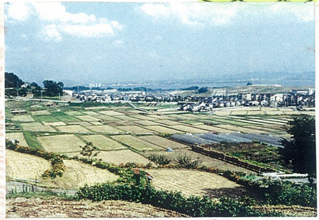
ほ場整備田(千枚田)