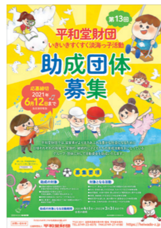
第13回いきいきすくすく淡海っ子活動募集ポスター

「いきいきすくすく淡海っ子活動」は、それぞれの地域で定期的、継続的に子どもたちの育成活動を行っているグループ、団体に対して、必要な活動資金を助成しています。2021年度は 23団体 、 総額約240万円 の活動費を助成しました。