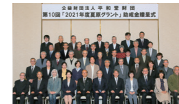
第10回「2021年度夏原グラント」助成金贈呈式

10年目を迎えた2021年度は、助成金贈呈式で 57団体(合計1,714万円) を助成しました。また、これまでの 10年間で延べ490団体・累計1億3,881万円 を助成しています。