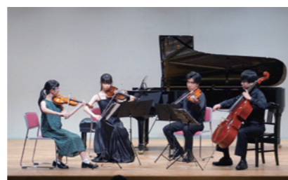
セミナー最終日の室内楽演奏会

7月22日～25日、第2回びわ湖ミュージックハーベスト2021を開催しました。 10～18歳の音楽家をめざす子どもたち18名 が集い、東京藝術大学から4名の講師を招き4日間のセミナーを受講し、最終日に約100名の観客を前に室内楽演奏会を開催しました。