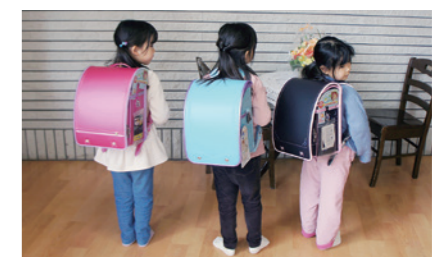
新1年生たちへランドセル贈呈

また、愛のハト育英奨学金については年間60万円に加えて、新型コロナウイルス感染症拡大に伴う臨時育英奨学金として、 30万円(15万円×2回) を給付し、コロナ禍での奨学生を支援しました。