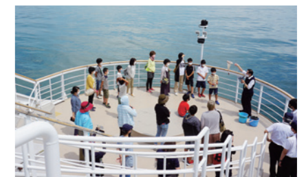
環境学習船megumiでプランクトン採取

子どもたちの自然環境保全への意識を高める環境体験プログラムによる活動を助成しています。2021年度は親子環境学習講座として、「カヌー体験湖岸調査」「環境学習船megumiに乗船」「トチノキ観察会」を5日間実施し約157万円を助成しました。