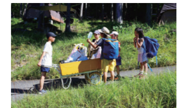
森のようちえんどろんこ園2021「森のがっこう 琵琶湖キャンプ」