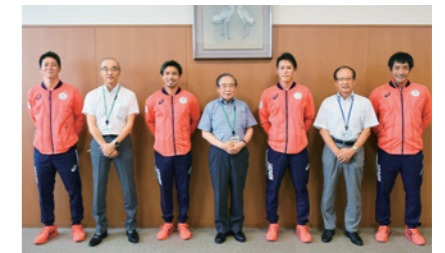
オリンピック男子ホッケー出場選手の結果報告会

2021年度は東京2020オリンピック・パラリンピックへの 出場選手28名 に対し、 総額280万円 の出場激励金を贈呈しました。その中で、大橋悠依選手、木村敬一選手がそれぞれ金メダルを受賞されました。