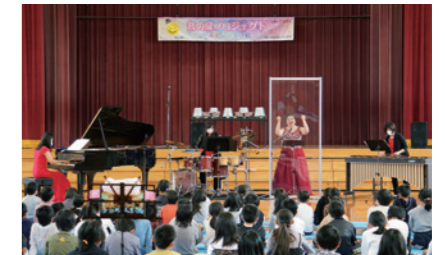
音の扉プロジェクト 学校訪問コンサート

音の扉プロジェクトは、滋賀県内の小学校を対象に、本格的な音楽に接する機会の少ない子どもたちが、本物の音楽や奏者に出会うことで、音楽の素晴らしさ、楽しさを身近なものと感じる機会を作ることをねらいとして実施しています。5月11日～14日に長浜市内の小学校4校で開催、これまでの 9年間で31校47公演 を開催しました。