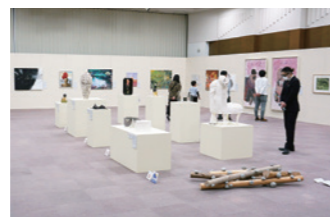
第27回新進芸術家美術展

2020年度平和堂財団芸術奨励賞受賞者2名を含む、これまでの 受賞者44名 の作品を一堂に会し、10月23日～31日に彦根ピハシティホール、11月9日～14日に草津クリアホールの2会場で美術展を開催、 1,000名以上の方にご来場 いただきました。