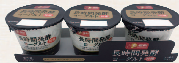
▲プレーンヨーグルトの黒・白の基調に合わせた高級感ある色合いのパッケージ

「長時間発酵ヨーグルト(プレーン) 400g」が発売されてから約3年。プレーンヨーグルトが苦手な方やお子様にもおいしく食べていただける加糖タイプのご要望をお客様からいただき開発されたのがこの商品です。ヨーグルト本来の風味を味わっていただきたいと「安定剤」・「香料」は使用しておらず、長時間じっくりと乳酸菌の働きで固形のヨーグルトになっているため、きめ細かくなめらかな食感が特長です。