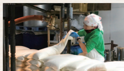
※1 木罎袋搾り 酒袋と呼ばれる布袋に膠を入れて、横にしながらかき、上から圧力をかけて搾る昔ながらの伝統製法。

本商品は「日本酒が好きで、滋賀にこだわった酒造りをしたい」「みなさんと美味しいお酒を飲みたい」という平和堂の創業者「夏原平次郎」の想いを受け継ぎ、60周年という節目の年に、これまでの感謝とこれからの一歩のために開発しました。