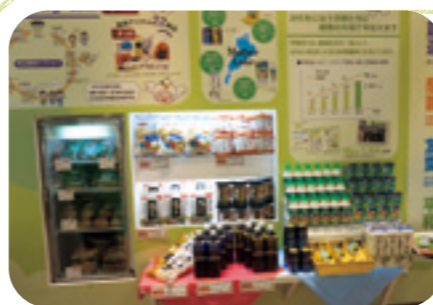
E-WA、マザーレイク 滋賀応援基金対象商品を紹介

滋賀県立長浜ドームで開催された日本最大級の環境産業総合見本市「びわ湖環境ビジネスメッセ」に今回も出展しました。循環エコ野菜・E-WA・環境セレクト商品・マザーレイク滋賀応援基金対象商品コーナーのほか、緑づくり・森づくりなどの活動や取組みをパネルやモニター、実物展示で紹介しました。3日間の来場者数は約33,000人。平和堂ブースのエコクイズ回答者は1,970名と多くの方にご来場いただきました。