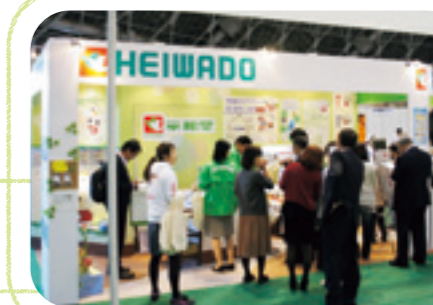
ブース来場者はエコクイズに挑戦