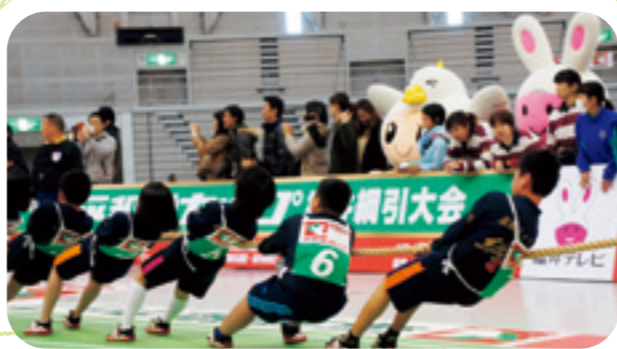
平和堂イメージキャラクターはとっぴーと福井テレビのイヤイヤちゃんも応援