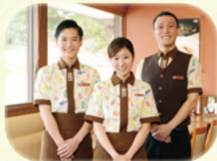
(株)ファイブスター