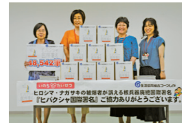
「ヒバクシャ国際署名」