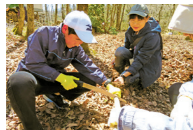
「山のおそうじ体験 in くつきの森」