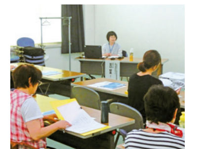
「ひたすらなるつながり（学習会）」（地域福祉員会）