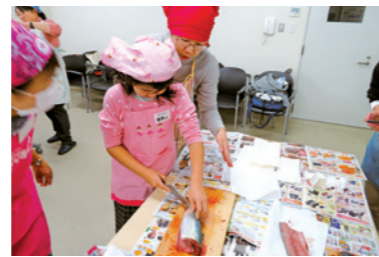
「魚をさばろう！」 (たべるたいせつ親子クラブ)