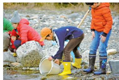
「在来魚で賑わうびわ湖をめざして」 (ビワマス稚魚の放流体験と学習)