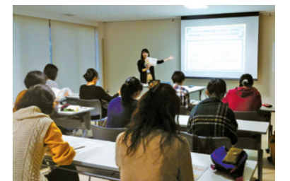
「保護者のためのケータイ安全教室」