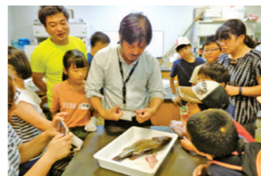
夏休み宿題応援企画 「びわ湖の水といきものたち」