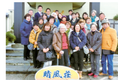
「2019震災を忘れないスタジアムツアー in ぶくしま」