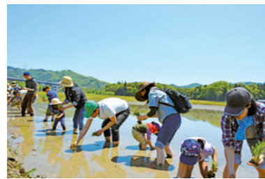
田植え・稲刈り体験