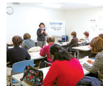
「託児協力員講習会」

コープしがのほとんどの組合員活動で「託児」が利用できます。お子さんたちを預かるのは、登録している組合員（託児協力員）です。子育て中のママたちの学びの時間を支えています。