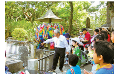
「沖縄戦跡・基地めぐり」