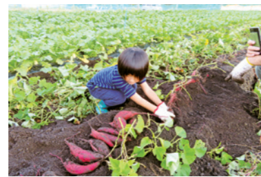
「さつまいもの収穫作業」 (ファーマーチャレンジ隊)