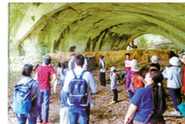
「県内戦争遺跡めぐり」 (八日市飛行場跡掩体壕)